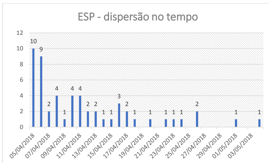
Gráfico 2: ESP, dispersão no tempo, 2018.

Em relação à dispersão das opiniões ao longo do tempo, verifica-se que há uma maior frequência de notícias mais próxima da data do julgamento (4 e 5/4/2018):