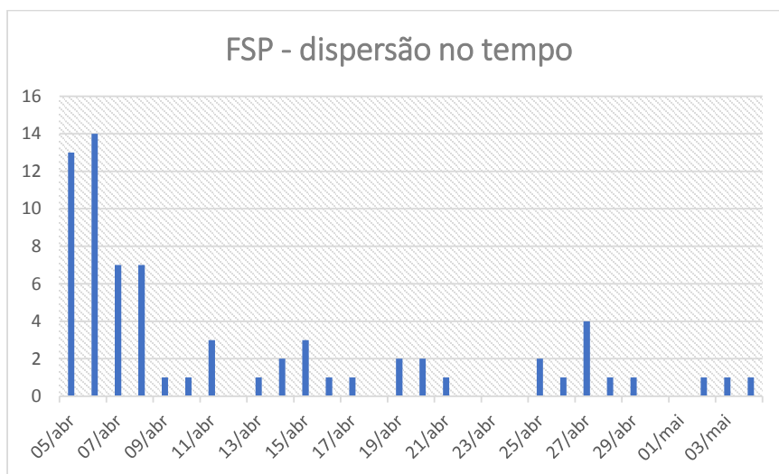
Gráfico 3: ESP, dispersão no tempo, 2018.

Após análise pormenorizada do perfil de leitores que se inserem na amostra analisada será possível o levantamento de perfil de gênero e origem dos interlocutores além de posterior análise qualitativa das opiniões externadas nos termos já indicados previamente.